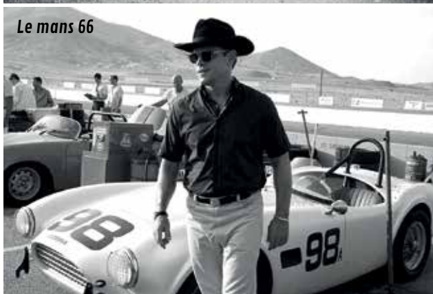
Le mans 66