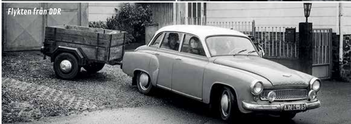
Flykten från DDR