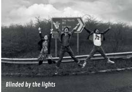
Blinded by the lights